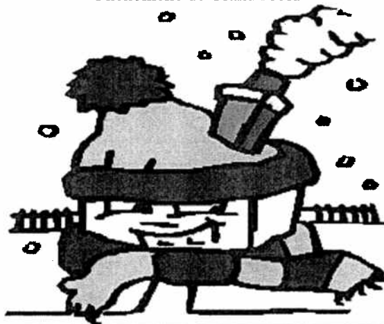
Phénomène de Grand Froid