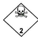
N°2.3 Gaz toxique