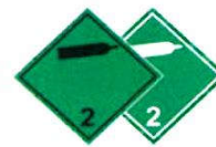
N°2.2 Gaz non inflammable et non toxique