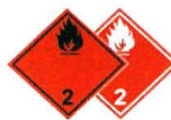
N°2.1 Gaz inflammable et non toxique