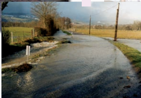
Inondation Bigotière 2001