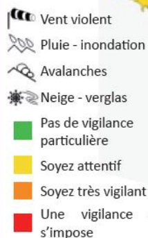
Exemple de carte de vigilance, publiée en 2009 pour la tempête Klaus.