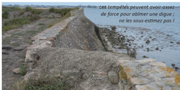
Les tempêtes peuvent avoir assez de force pour abîmer une digue ; ne les sous-estimez pas !