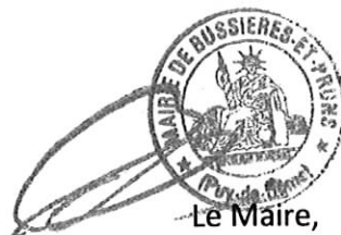
Le Maire, Josette BREYSSE

Ce document vise à informer l'ensemble des habitants des dangers potentiels et sur la conduite à tenir en cas d'accident.