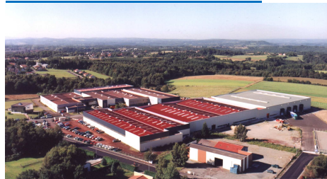
Zone Industrielle- Route de Queuille 63 780 SAINT GEORGES DE MONS