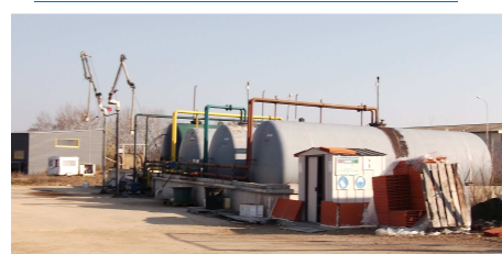
Zone Industrielle – Route de Queuille 63780 SAINT GEORGES DE MONS