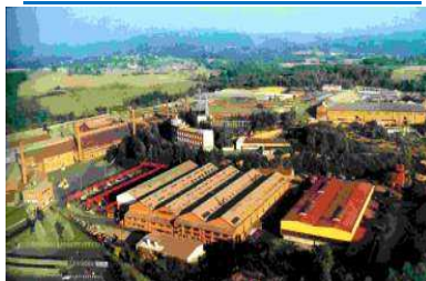
63 770 LES ANCIZES COMPS