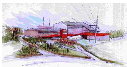
Route Départementale 62 63 780 SAINT GEORGES DE MONS