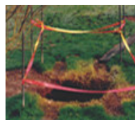
Mouvement de terrain (cavités souterraines)