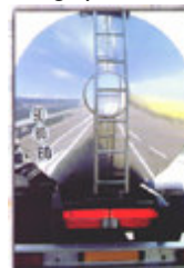
Transport de matières dangereuses