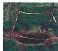
Mouvement de terrain