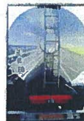
Transport de matières dangereuses