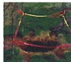
Mouvement de terrain (cavités souterraines)