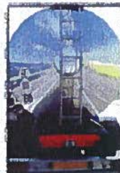
Transport de matières dangereuses