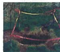
Mouvement de terrain (cavités souterraines)