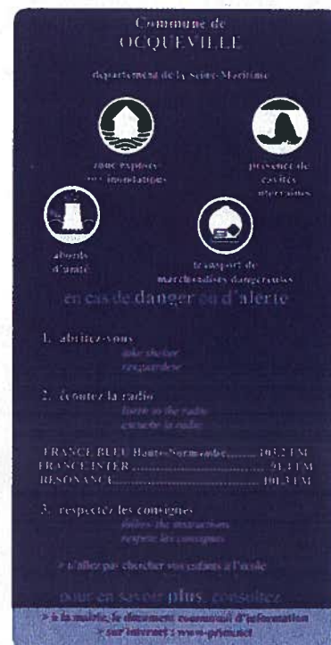
Modèle de l'affiche qui sera apposée par le maire dans les établissements recevant du public (ERP)

Les affiches sont disponibles en mairie. Le plan d'affichage, élaboré par le maire, répertorie risque par risque les locaux de plus de 50 personnes ou 15 logements situés dans les zones concernées. Au vu du plan d'affichage, les affiches devront être apposées par les propriétaires à chaque entrée de bâtiments ou à raison d'une affiche par 5000 m 2 pour les terrains de camping et stationnement de caravanes.