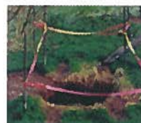
Mouvement de terrain (cavités souterraines)