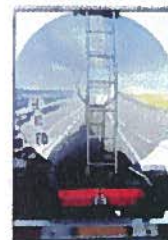
Transport de matières dangereuses