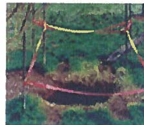
Mouvement de terrain (cavités souterraines)