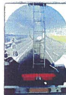
Transport de matières dangereuses