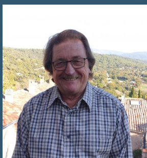
Le Maire de Moissac-Bellevue

En de telles circonstances, vigilance et entraide sont nécessaires et salvatrices.