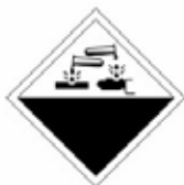
MATIERE OU GAZ CORROSIF