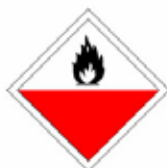
LIQUIDE OU SOLIDE A INFLAMMATION SPONTANÉE