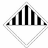
MATIERE PRESENTANT DES RISQUES DIVERS

A retenir : Transport de Matières Dangereuses