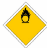
COMBURANT OU PEROXYDE ORGANIQUE