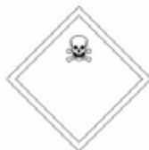
MATIERE OU GAZ TOXIQUE