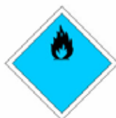
LIQUIDE OU SOLIDE PRESENTANT DES ÉMANATIONS DE GAZ INFLAMMABLE AU CONTACT DE L'EAU