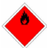
GAZ OU LIQUIDE INFLAMMABLE