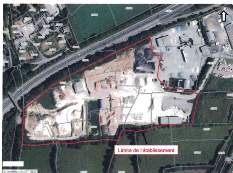
Figure 2: Emprise cadastrale de l'établissement