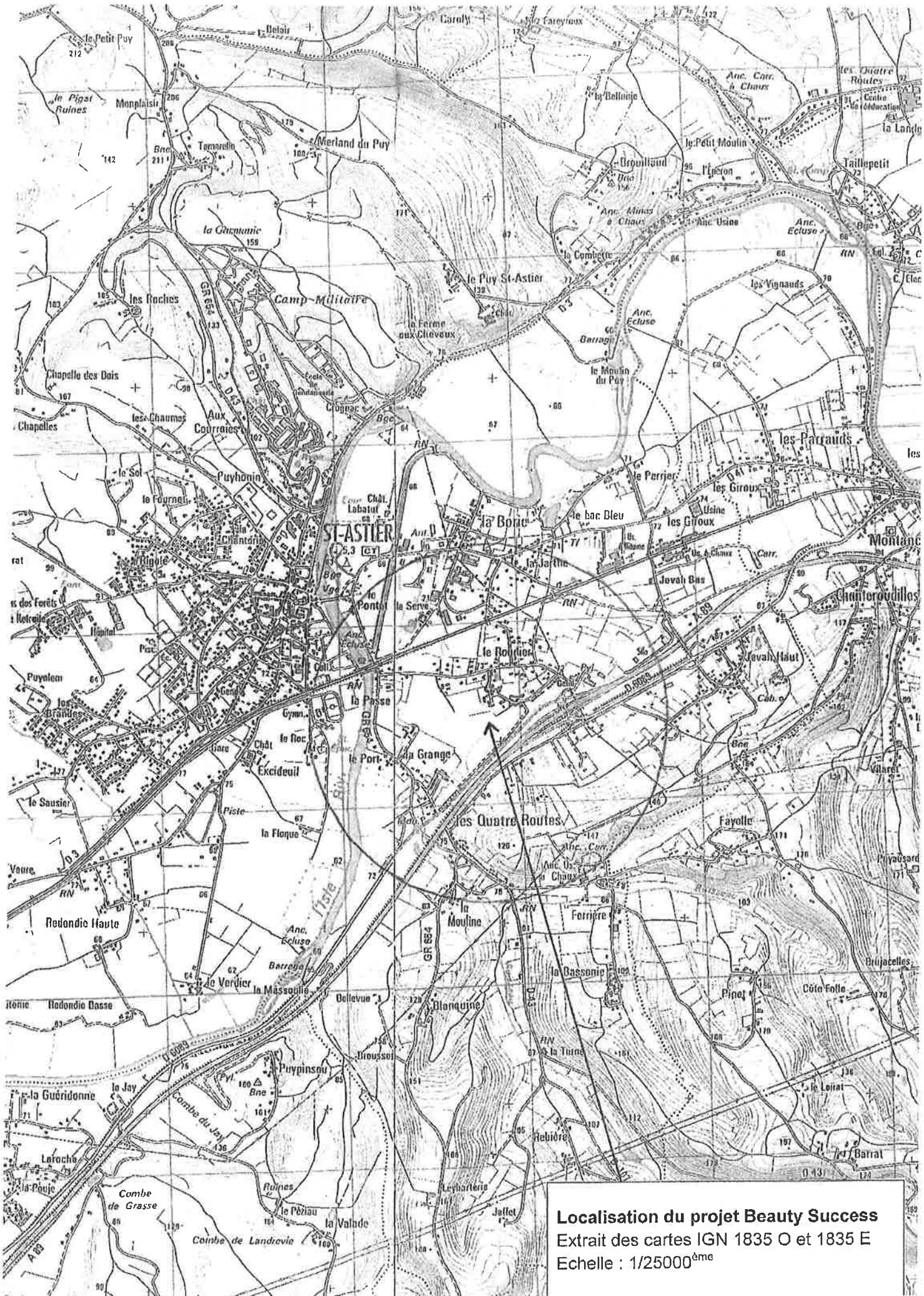
Localisation du projet Beauty Success Extrait des cartes IGN 1835 O et 1835 E Echelle : 1/25000 ème