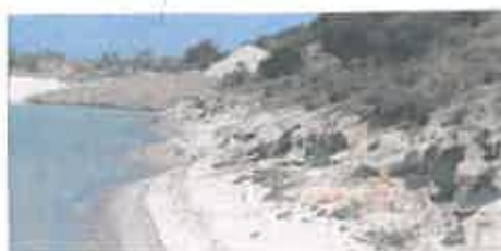
Berge sud en cours de remise en état