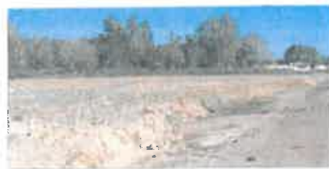
Secteur en cours de remblayage