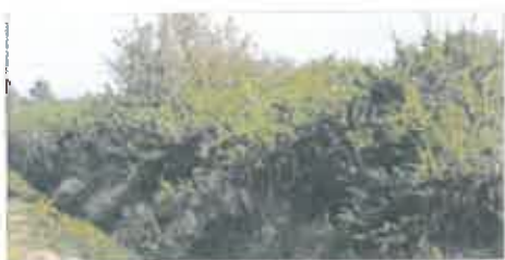
Merlon nord végétalisé