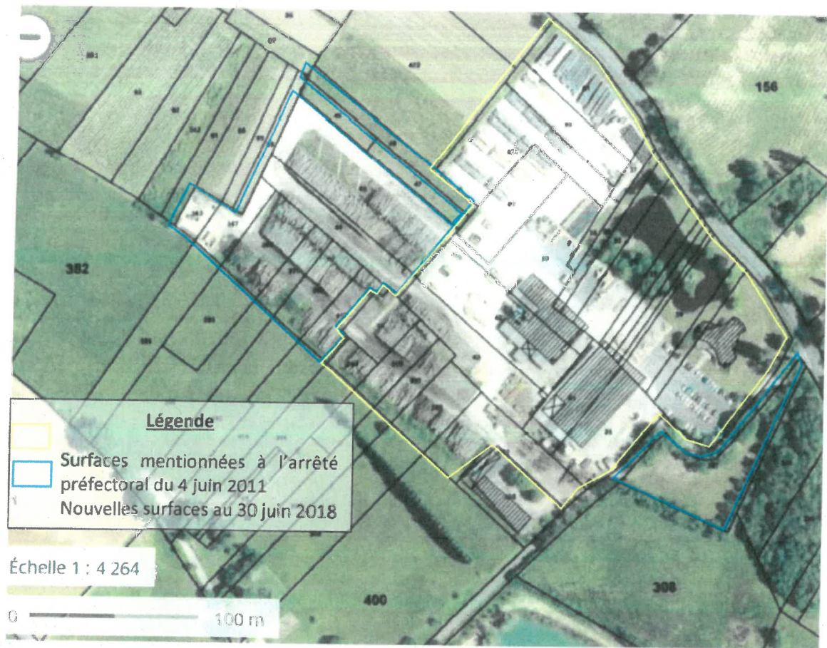
Plan présentant les parcelles