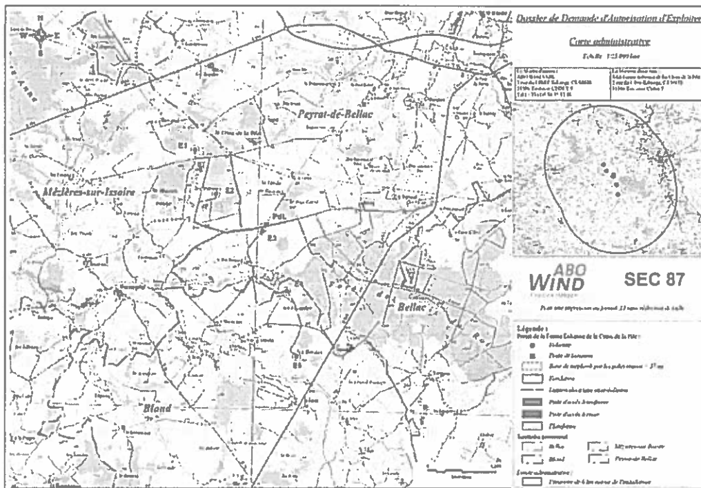
Localisation des éoliennes – extrait du dossier