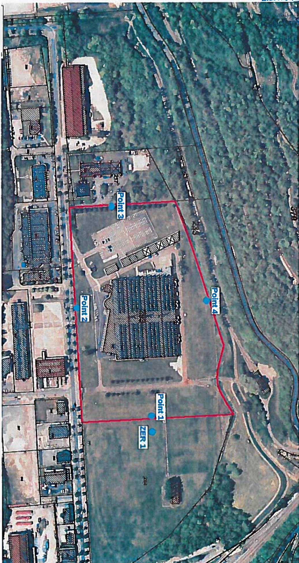
ANNEXE 1 : Localisation des points de mesure liés aux nuisances sonores