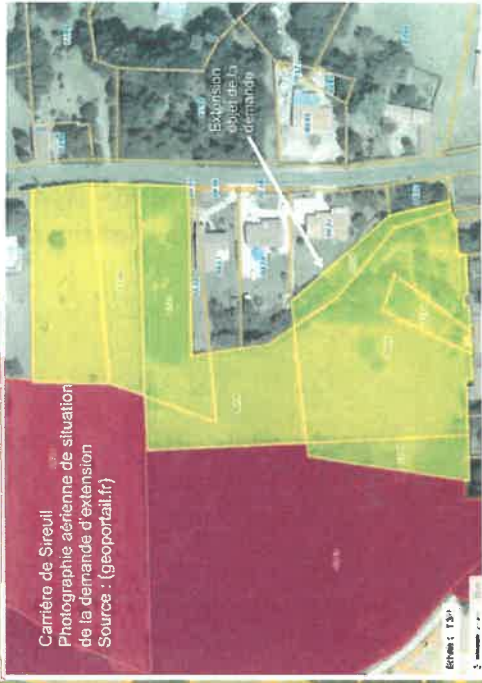
Carrière de Sireuil Photographie aérienne de situation de la demande d'extension