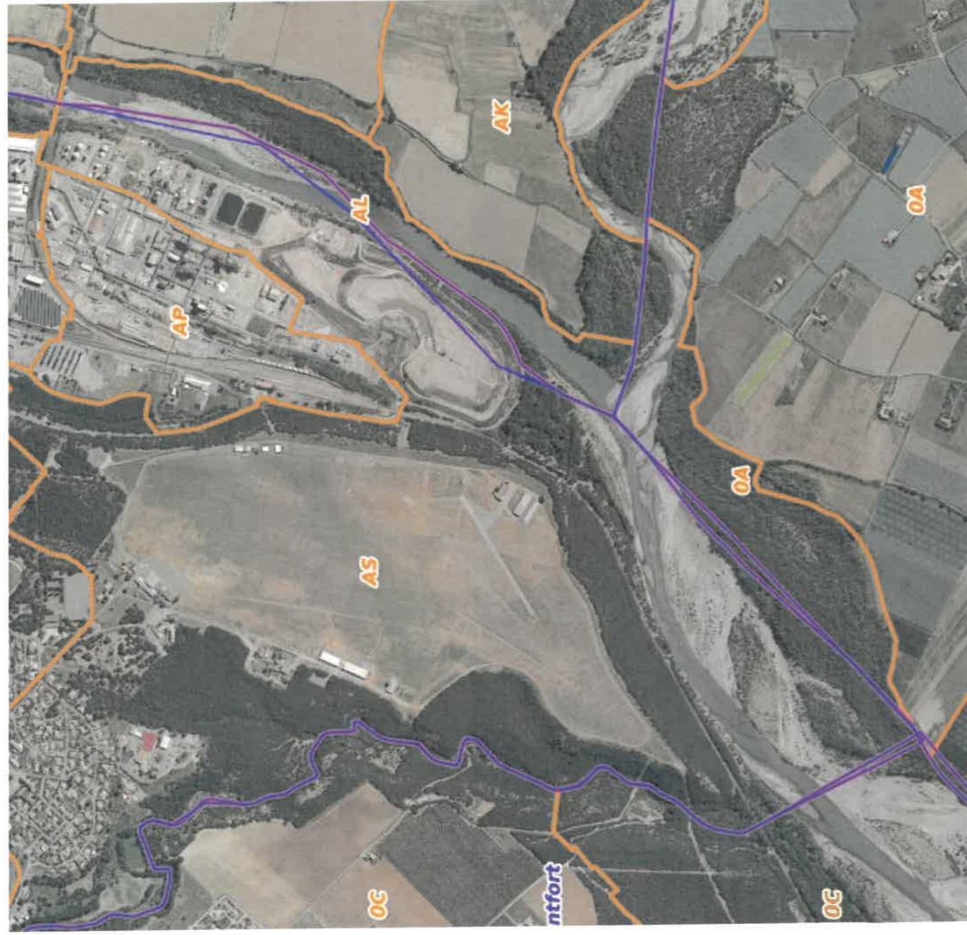
Illustration 3: Vue aérienne des parcelles concernées par l'interdiction d'usage des eaux souterraines. Détail des parcelles dans l'illustration suivante.