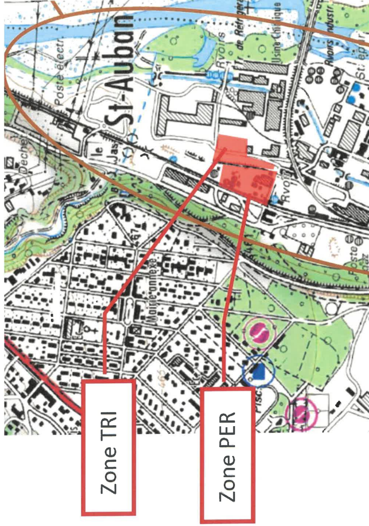
Illustration 1: Plan de situation des zones TRI et PER