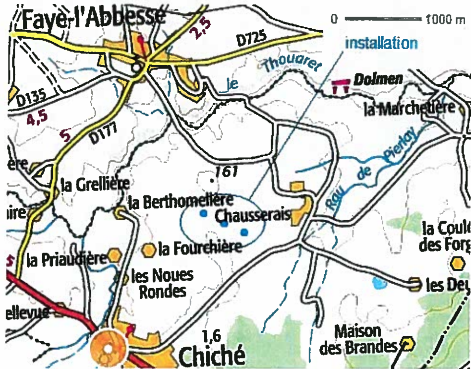
Localisation de l'installation exploitée par la société EOLIENNES CHEMIN VERT à Chiché