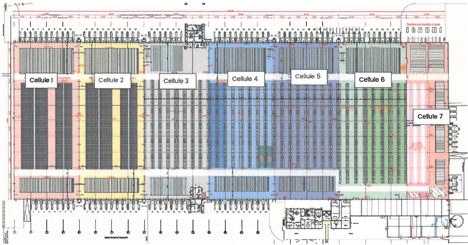
IPD B – Cellules de stockage du nouveau bâtiment