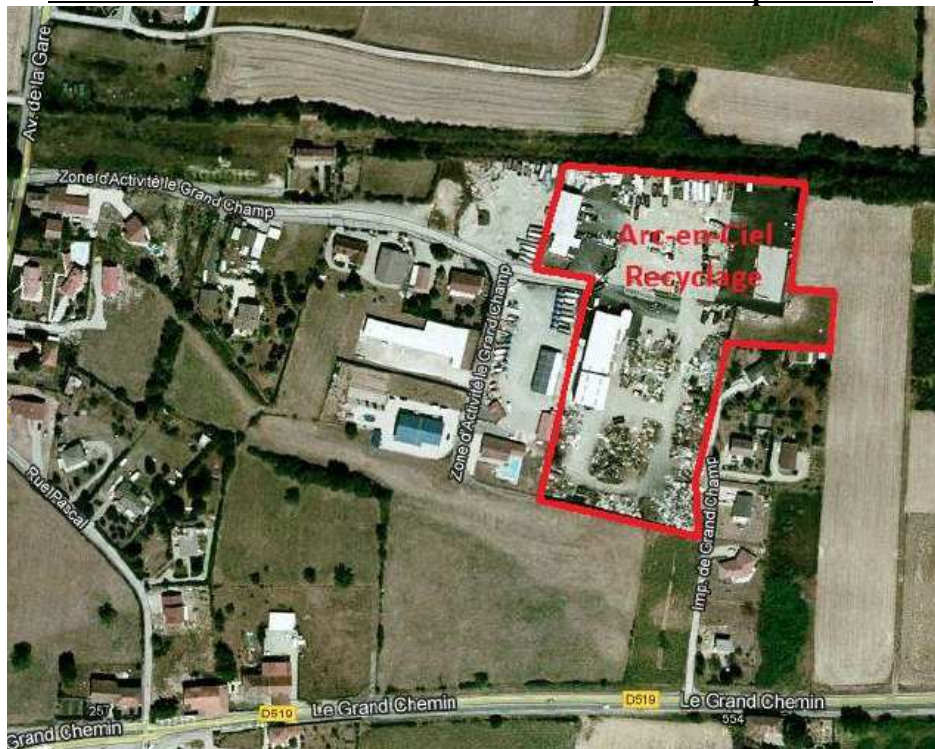
Vue aérienne extraite du dossier de modification de 2013