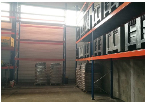
Lot 5 : vue intérieure du bâtiment (granulés)