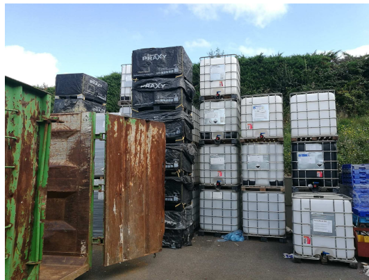
Lot 5 : stockage extérieur