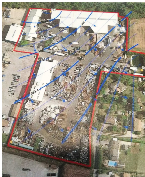
Figure 9. Esquisse piézométrique de février 2021