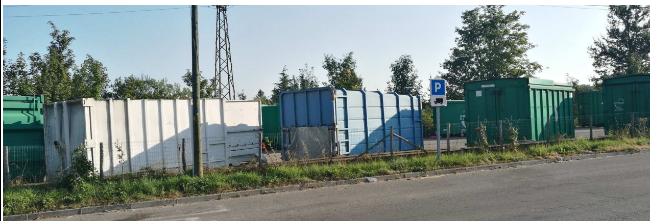
Vue d'une partie du parc à bennes

Les plaignants alertent tout particulièrement sur les nuisances sonores et vibratoires qui troublent leur quiétude. Ils suspectent également les vibrations générées par les poses et déposes des bennes (parfois brutales selon leurs dires) d'occasionner des dégâts matériels à leur maison et à leur atelier (fissures notamment).