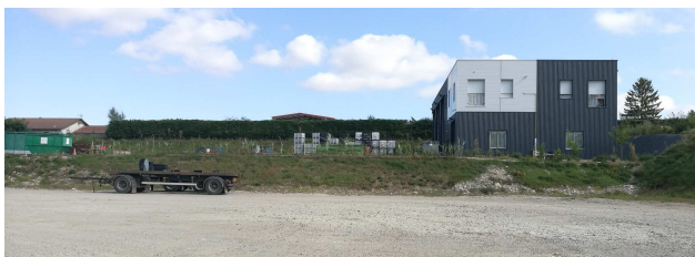
Lot 5 : vue extérieure du bâtiment

La parcelle aux contours verts, identifiée « lot 5 », a été acquise récemment et un bâtiment y a été construit en 2019. Il abrite un logement occupé par un salarié, des garages dans lesquels des granulés de chauffage (activité commerciale d'Arc en Ciel non classée) et divers matériels sont stockés, un espace extérieur sur lequel des contenants vides sont stockés. Il s'agit d'une extension géographique de l'activité et par conséquent aurait dû faire l'objet d'un dossier de porter à connaissance adressé au préfet.