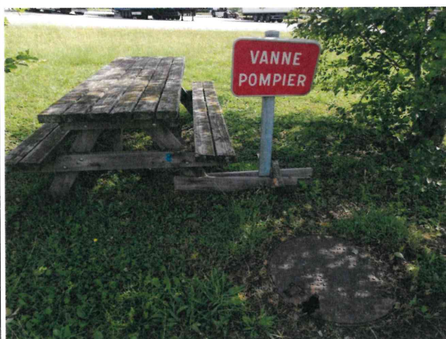
Photo 2 Vanne pompier