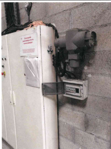
Photo 1 commande automatique de la vanne pompier