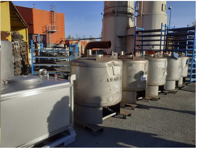
Le site, très empoussiéré, abrite encore de nombreux déchets :