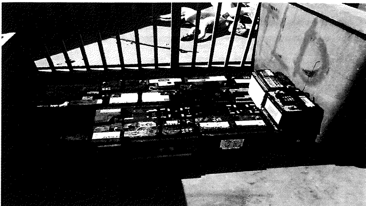
Illustration 3: Stockage de batteries