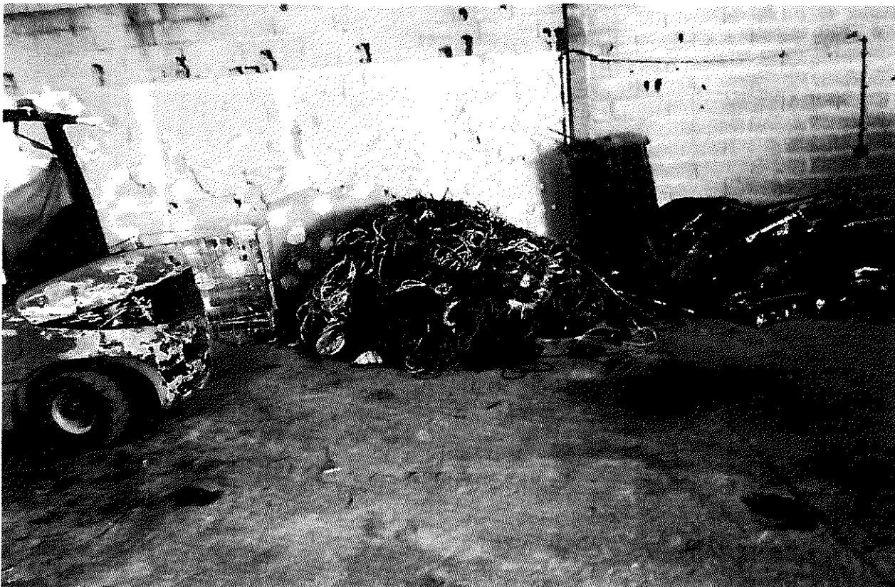
Illustration 4: Stockage de fils électrique à l'intérieur du bâtiment