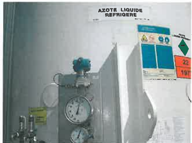
Dispositif de mesure de la pression en continu (bleu) en vue de rechercher les causes de la fuite d'azote sur la cuve de stockage