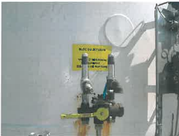
Vanne par laquelle l'azote a été mis à l'air libre