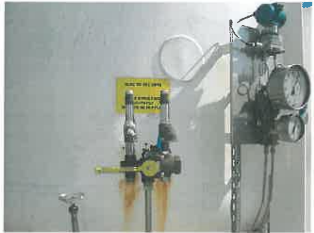
Vanne par laquelle l'azote a été mis à l'air libre