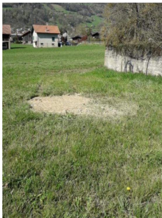
Prélèvements réalisés précédemment à la pelle mécanique