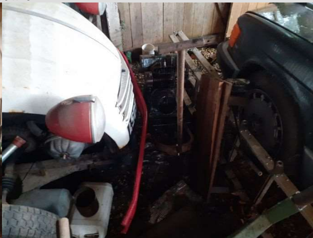
Moteur posé à même le sol. Le jour de l'inspection, la pluie tombe sur le moteur du fait d'un défaut d'étanchéité de la toiture