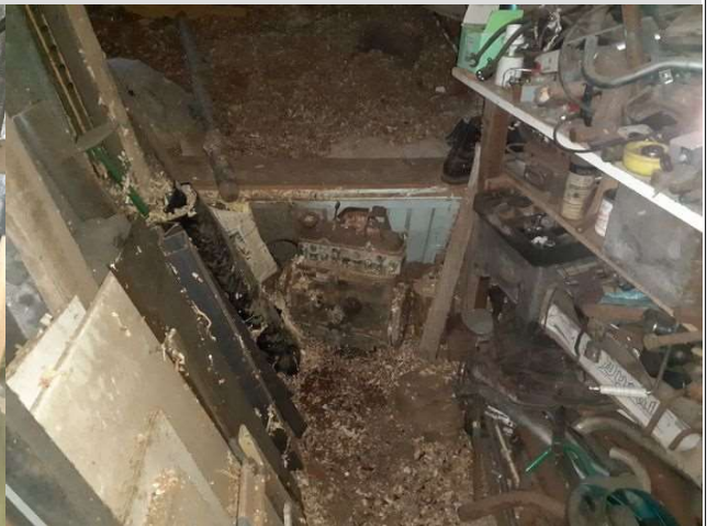
Moteur posé à même le sol