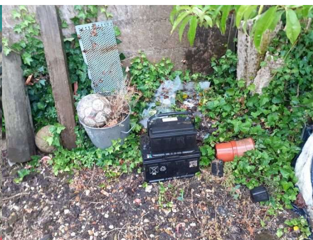
Batteries stockées en extérieur à même le sol

L'activité relève du régime de l'enregistrement au titre de la rubrique n° 2712-1 de la nomenclature des ICPE, correspondant à une activité d'entreposage, dépollution, démontage ou découpage de VHU ; le seuil du régime de l'enregistrement étant de 100 m 2 . De plus, tout exploitant d'une installation de stockage, de dépollution, de démontage, de découpage ou de broyage des véhicules hors d'usage doit être agréé à cet effet.