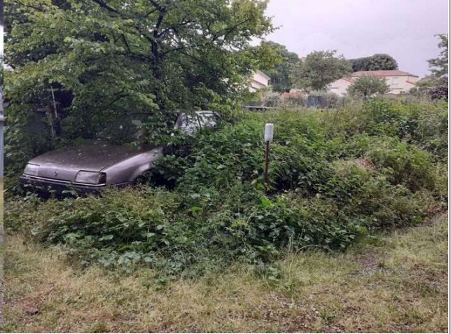
VHU recouvert par la végétation