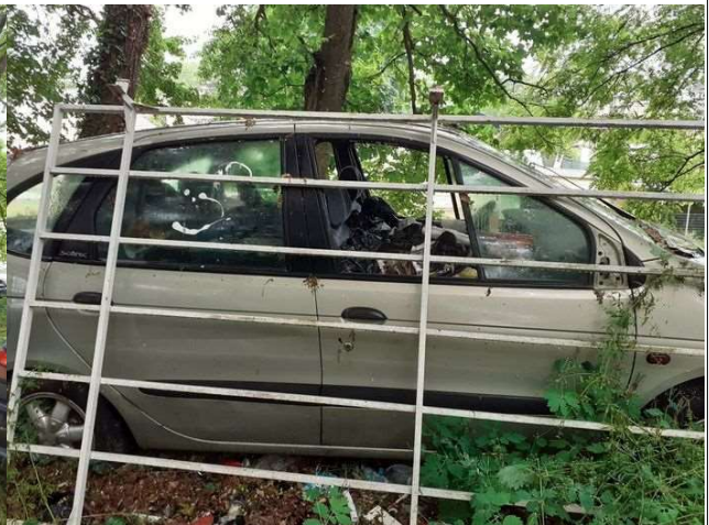
VHU plein de déchets