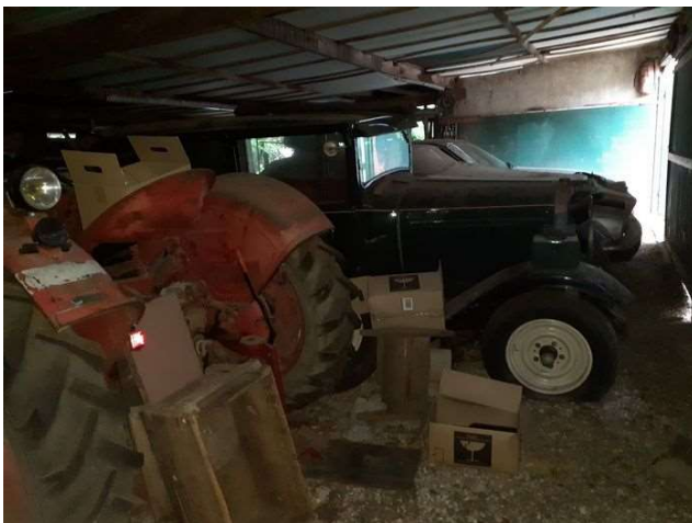
Véhicule et tracteur