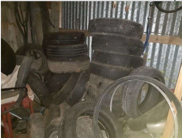
Stockage de pneumatiques