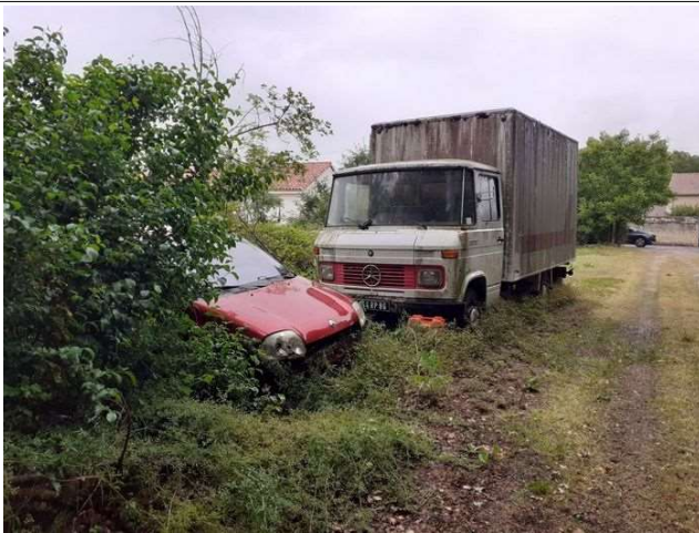
VHU et camion