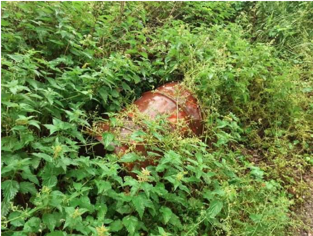
Fût recouvert par la végétation