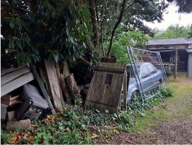
VHU et déchets divers