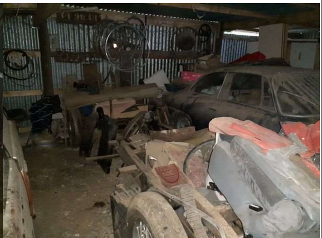
Véhicule et déchets divers