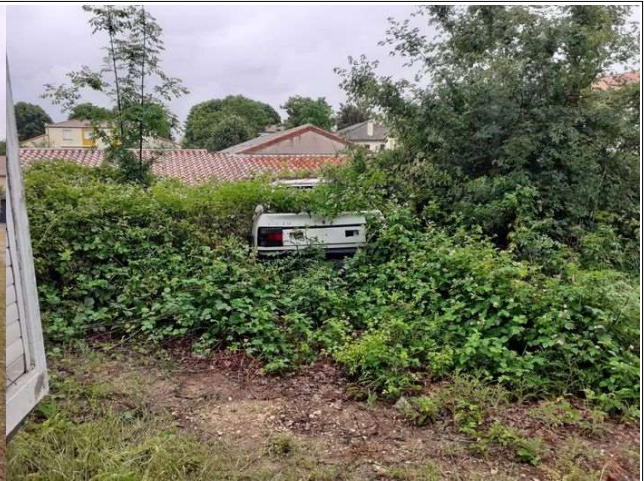
VHU recouvert par la végétation