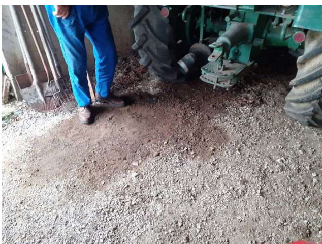
Sol taché témoignant de fuite de fluide sur les véhicules et tracteurs stockés