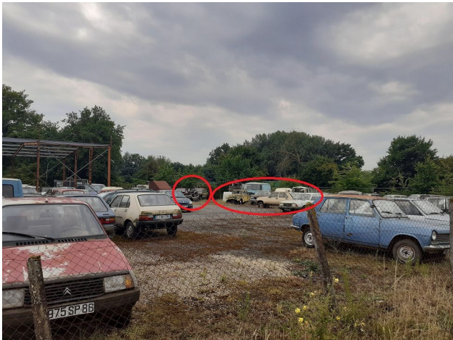
Des véhicules à l'état d'épave sont visibles depuis la voie publique