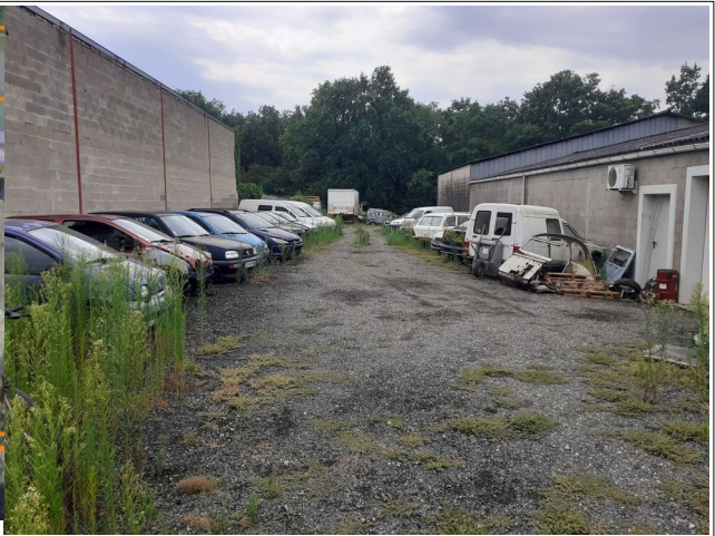
Les véhicules sont stockés sur le site dans des états divers