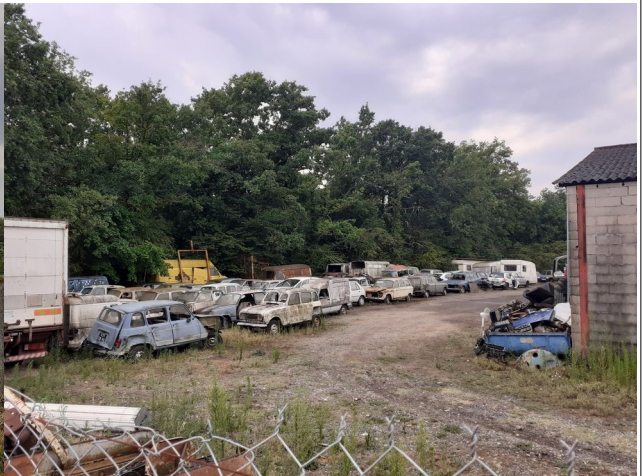
L'arrière du site, visible depuis le site voisin, est dédié au stockage de véhicules visiblement hors d'usage (environ une quarantaine). Une benne contenant divers pièces, déchets et moteurs est également visible.