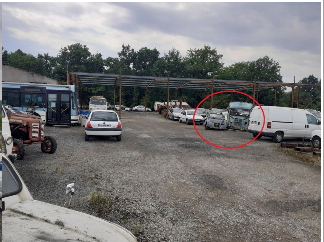
Des véhicules à l'état d'épave sont visibles depuis la voie publique