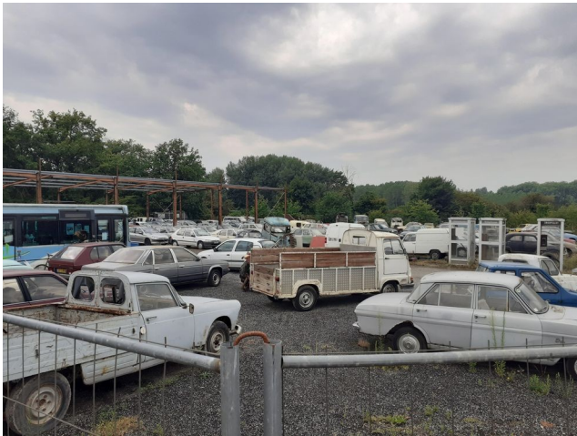
Ces véhicules sont principalement des voitures anciennes. Certaines sont plus récentes, et des camions, des tracteurs et des bus sont également stockés