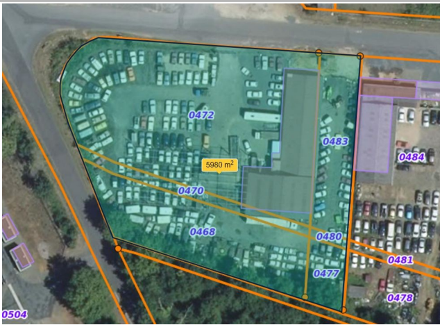
Le site occupe une surface de près de 6 000 m 2 , majoritairement dédié au stockage de véhicules