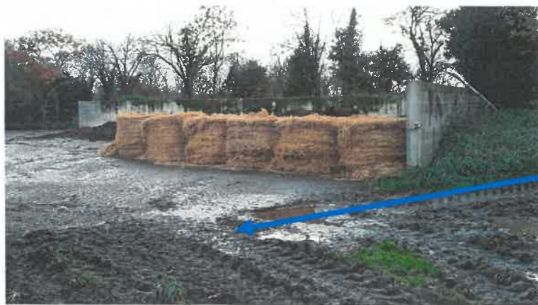
Grille d'évacuation des eaux de pluie

La fosse géomembrane recueillant les jus de cette fumière a été signalée par un panneau danger depuis la dernière inspection.